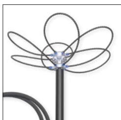
2 Düsen-Sets: 1.200 – 1.800 und 1.800 – 3.000 l/h