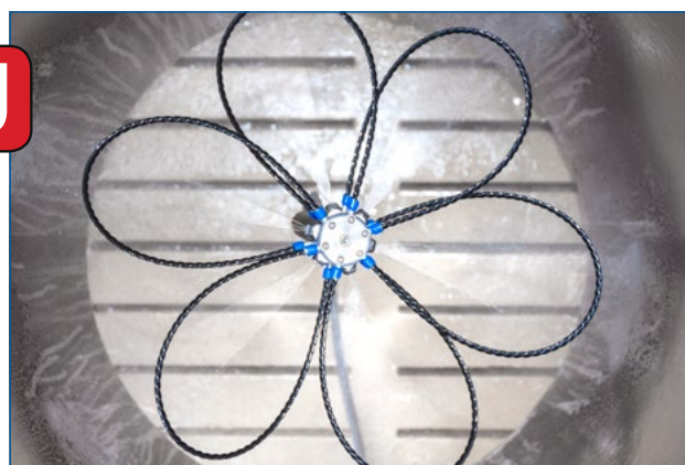
Praxisfoto Flexi-Universal im Kamin

Komfortable Reinigung von Abluftkaminen durch flexiblen Hochdruckreinigungskopf, der sich samt Schlauch automatisch im Rohr hochzieht.